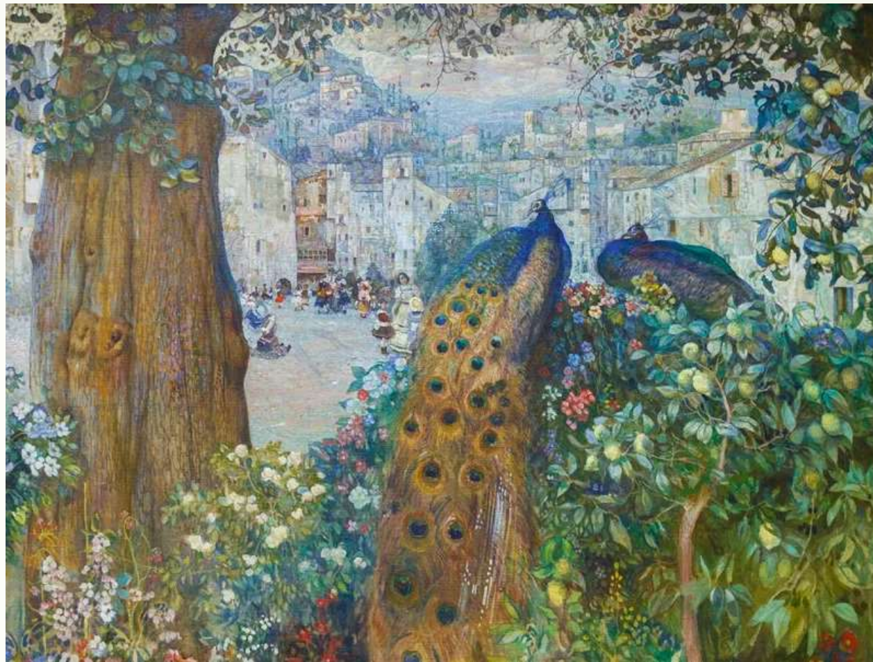
Бродский И. «Сказка» (фрагмент), 1911 г.