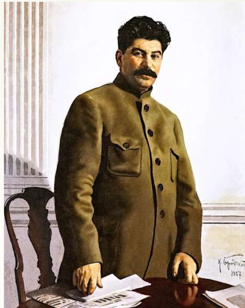
Бродский И. «Портрет Иосифа Сталина» (фрагмент), 1927 г.

Свое творчество 1920–30-х годов Бродский посвятил революционной тематике, а главным направлением в живописи избрал социалистический реализм. На своих картинах он часто изображал Владимира Ленина, Иосифа Сталина, Михаила Калинина, Климента Ворошилова и других идеологов революции. В 1932 году Бродский стал сначала преподавателем, а через два года — директором Всероссийской академии художеств. Также он возглавил Ленинградский институт живописи, скульптуры и архитектуры. Руководство забирало у него много времени и сил. Зимой 1938 года Бродский писал: «Мне очень трудно ощущать себя оторванным от мольберта, от своего любимого дела и быть обремененным той работой, которая мне никак не свойственна и для меня непосильна».