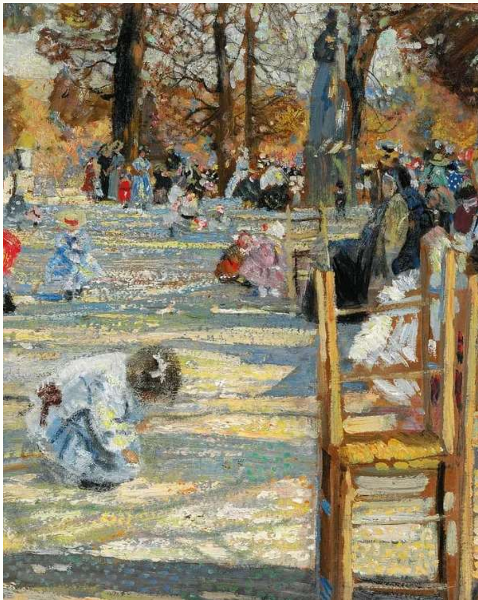
Бродский И. «Люксембургский сад весной» (фрагмент), 1910 г.