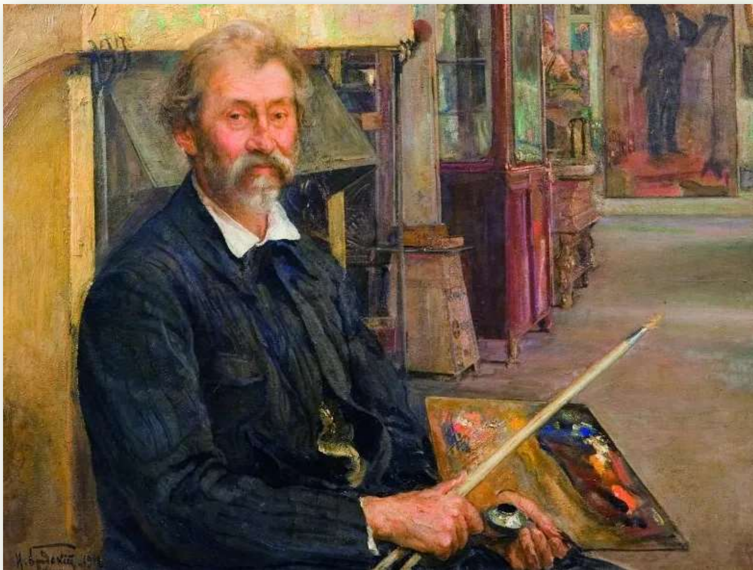
Бродский И. «Портрет Ильи Репина» (фрагмент), 1912 г.