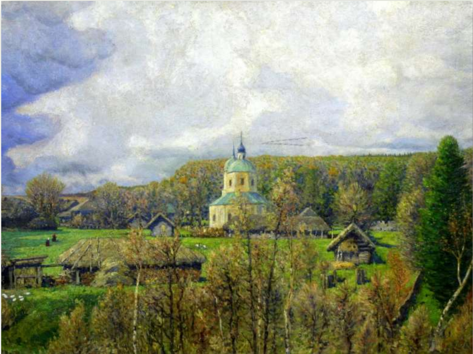
Бродский И. «Деревня Софиевка» (фрагмент), 1902 г.