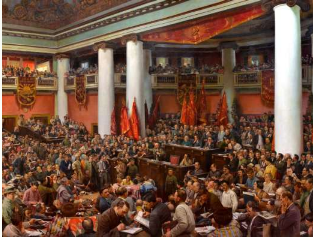
Бродский И. «Торжественное открытие II конгресса Коминтерна во дворце Урицкого в Ленинграде» (фрагмент), 1920-1924 г.

Летом 1920 года Исаак Бродский попал на открытие II конгресса Коммунистического интернационала в Петрограде. Во время заседания он сделал наброски к портрету Ленина, а потом показал ему свой эскиз и попросил подписать. Поначалу вождь революции решил, что на рисунках он не похож на себя, но люди вокруг убедили его в обратном. «Первый раз в жизни подписываюсь под тем, с чем не согласен!» — в итоге сказал Владимир Ленин и поставил автограф. В дальнейшем мастеру выдали именной пропуск, он часто бывал на деловых встречах и изображал вождя за работой.