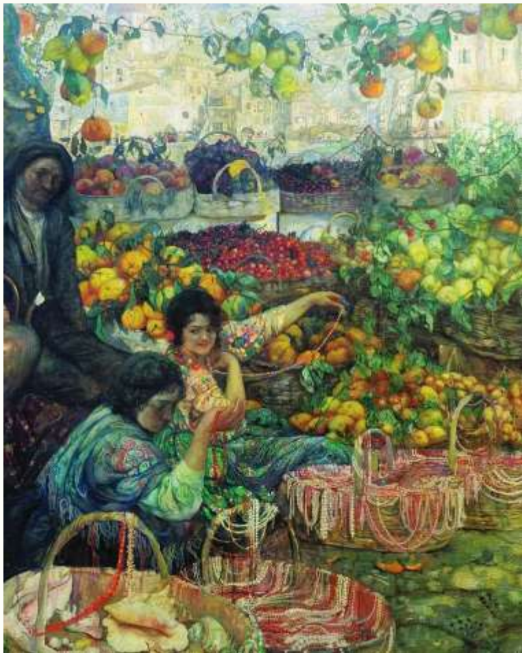
Бродский И. «Италия» (фрагмент), 1911 г.

Итогом путешествий художника стали известные картины «Сказка» и «Италия». Бродский писал: «В этих работах я как бы суммировал свои впечатления от увиденных мною стран». За «Сказку» он получил крупную денежную премию на Всероссийском конкурсе Общества поощрения художеств. Полотна мастера участвовали и на других отечественных и зарубежных выставках.