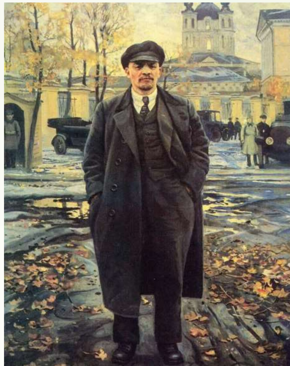
Бродский И. «Владимир Ленин на фоне Смольного» (фрагмент), 1925 г.

Бродский вошел в состав нового Исполнительного комитета по делам искусств и посещал заседания, которые проходили на квартире Максима Горького. Там он познакомился с наркомом просвещения Анатолием Луначарским и попросил отрекомендовать его Владимиру Ленину. Художник видел вождя «исключительной и крайне интересной для изображения» личностью.