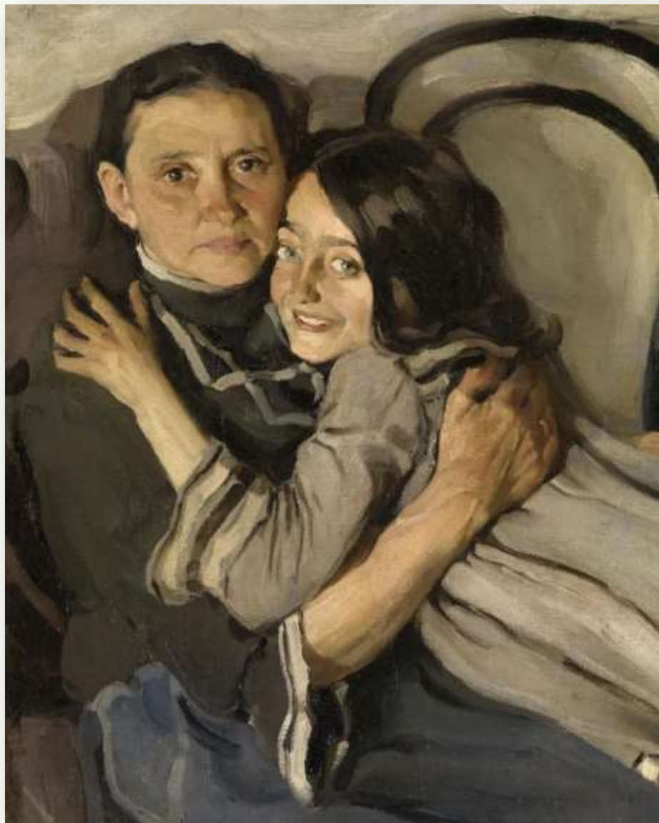
Бродский И. «Портрет матери и сестры художника» (фрагмент), 1905 г.