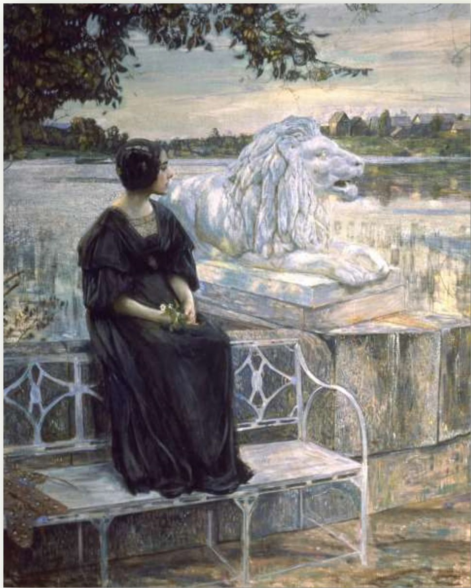
Бродский И. «Портрет Л.М. Бродской» (фрагмент), 1908 г.