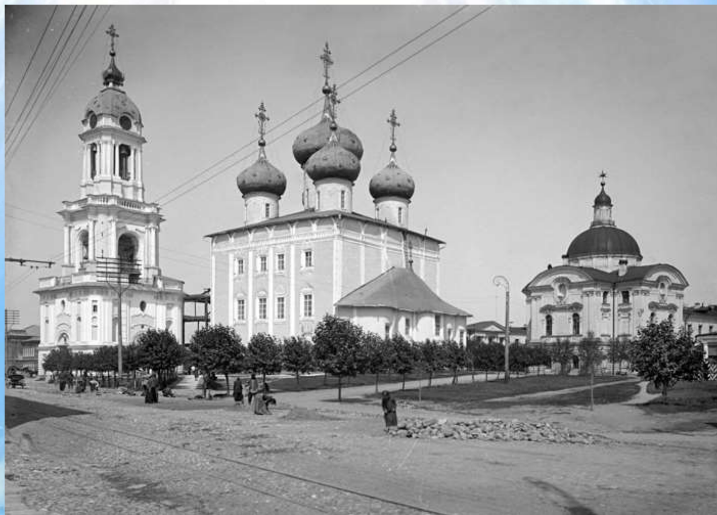
Тверской Спасо-Преображенский собор