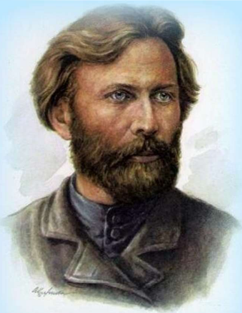
Иван Захарович Суриков [1841—1880]