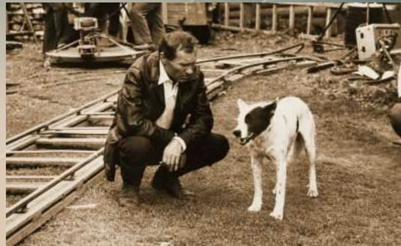
Василий Шукшин на съёмочной площадке художественного фильма «Калина красная».

Как актёр, Василий Шукшин снялся более чем в 30 картинах, из них в семи – в главной роли. Как режиссёр, он снял пять картин. Первый большой актёрский успех пришёл ещё во время учёбы во ВГИКе, после вышедшего на экраны в 1958 году фильма «Два Фёдора». Шукшин сыграл фронтовика, по возвращении с войны подобрывшего мальчишку-беспризорника. Удачными оказались роли председателя колхоза в «Когда деревья были большими» (1961), директора комбината в «У озера» (1969), маршала Конева в «Освобождении» (1971), Василия Улыбина в «Даурии» (1971).