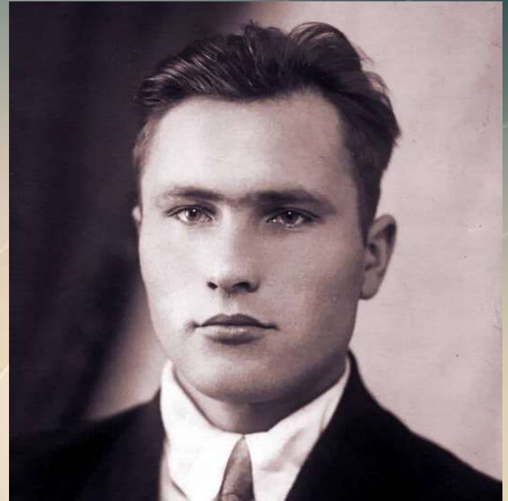
Студент ВГИКа Василий Шукшин, 1958 год