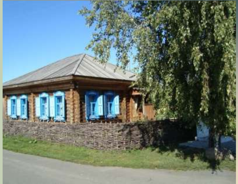
Дом Шукшина в селе Сростки (Алтайский Край)