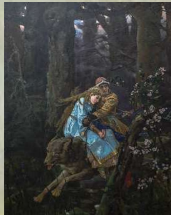
«Иван-Царевич на Сером Волке»