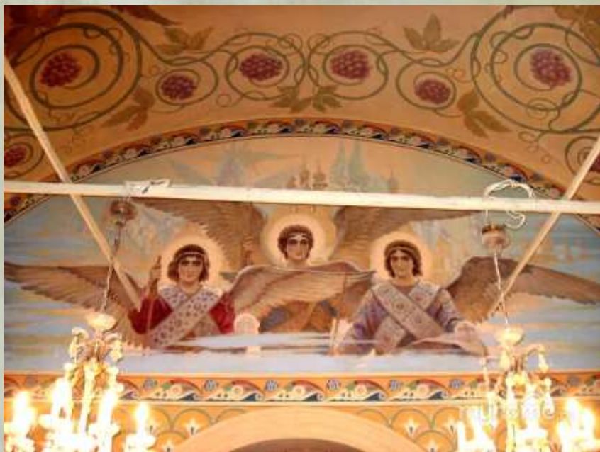
Храм Рождества Иоанна Предтечи

Спустя некоторое время Васнецова увлекла религиозная тема. Художник расписал петербургский храм Спас-На-Крови. Его кисти принадлежит стенная живопись в Храме Рождества Иоанна Предтечи. Вместе с другими художниками Васнецов разрабатывал проект храма-памятника Александру Невскому в городе Софии.