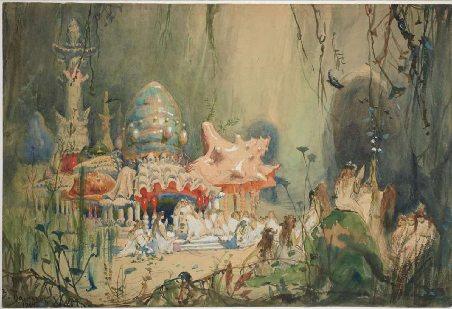
Декорации к опере Даргомыжского «Русалка»

Кроме «Снегурочки» Васнецов занимался оформлением сцены театра для постановки драмы «Чародейка» Шпажинского и оперы «Русалка» Даргомыжского. Даже сейчас, в современных театрах, подводные пейзажи «Русалки» изображают с учетом декораций, созданных в свое время Виктором Васнецовым.