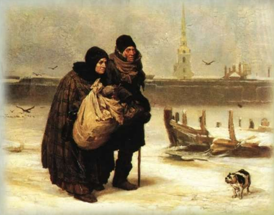
«С квартиры на квартиру»

Диплом Академии Васнецов получил в 1873-м, но его творческая биография началась гораздо раньше. Свои первые картины начинающий художник выставил в 1869-м, их включили в экспозицию Академии художеств. А после того, как Васнецов стал членом Товарищества передвижных художественных выставок, его полотна участвовали в выставках, которые организовывало это товарищество.