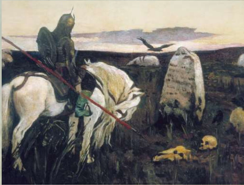
«Випязь на распутье»

К концу XIX века творчество художника перешло во второй этап, так как общество стало больше интересоваться «преданьями старины глубокой». Особенностью этого этапа стало сочетание истории и фольклора. Из-под кисти Васнецова выходили полотна, которые не могли не пронуть самые потаенные уголки души каждого русского человека. В этот период своей творческой биографии живописец создал «Випязь на распутье», «Гусляров», «Ивана-Царевича на Сером Волке», «Алёнушку», «Трёх богатырей». Последнее полотно, с изображенными на нем Ильей Муромцем, Добрыней Никитичем и Алешей Поповичем, стало визитной карточкой художника.