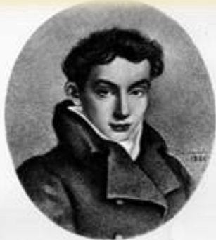
Победителю-ученику от побежденного учителя Василию Жуковскому от Александра Пушкина 1820