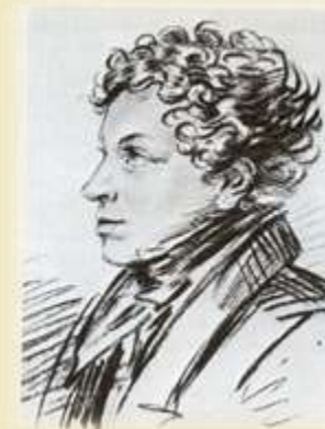
Л. С. Пушкин (1805—1852)