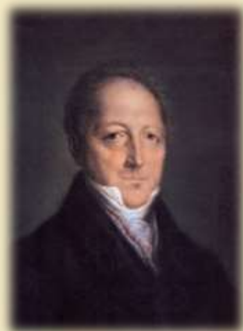
С. Л. Пушкин (1770—1848)