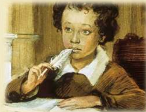
А. С. Пушкин (1799 — 1837)