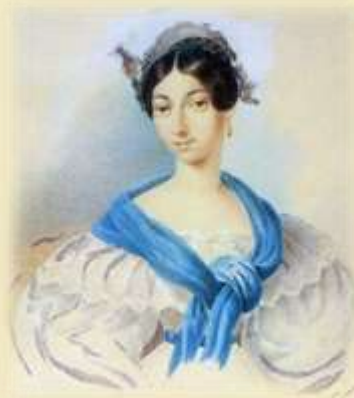
О. С. Пушкина (1797—1868)