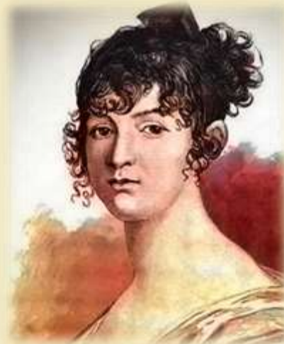
Н. О. Пушкина (1775—1836)