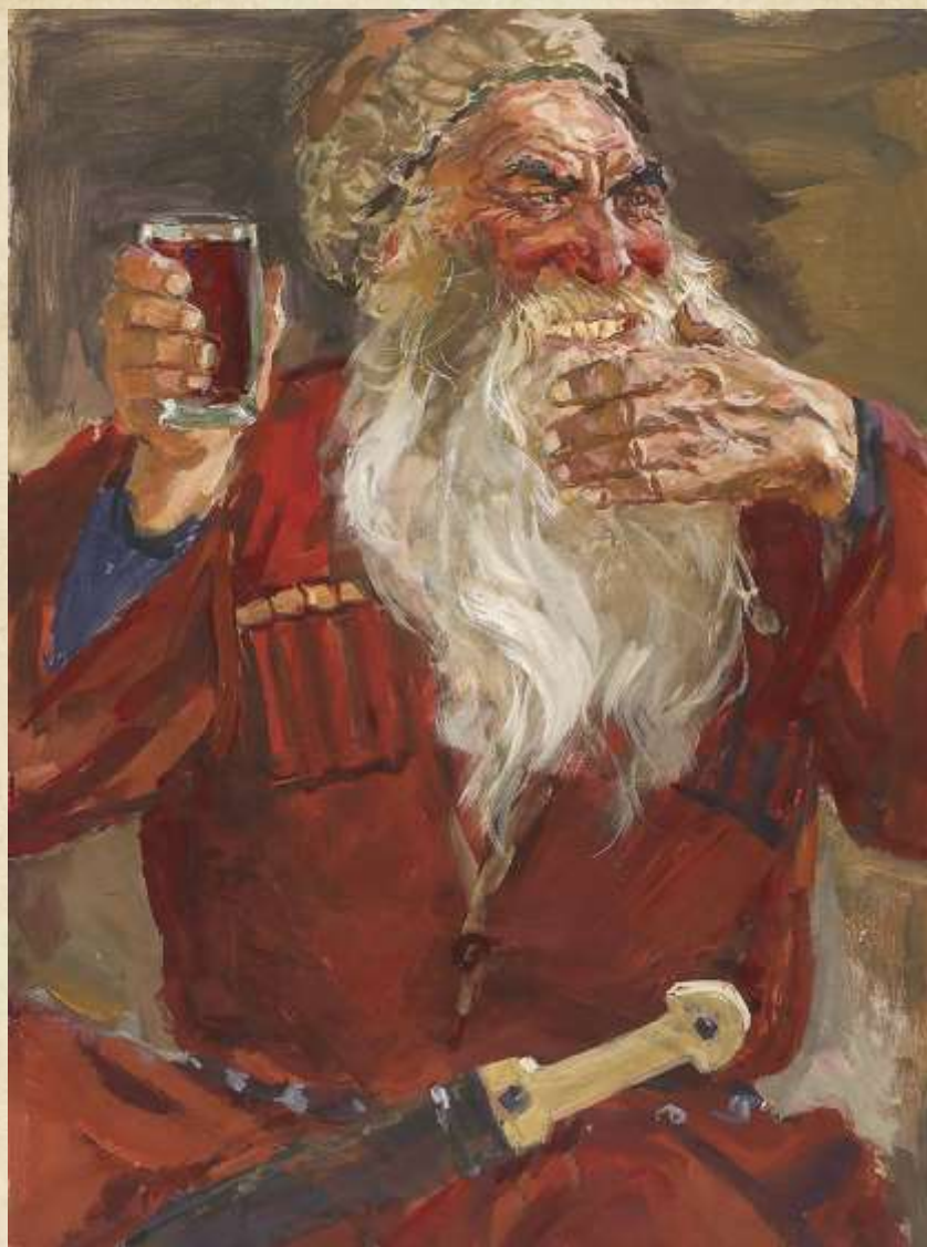
Иллюстрация к повести Л.Н. Толстого «Казачи». Дядя Ерoшкa