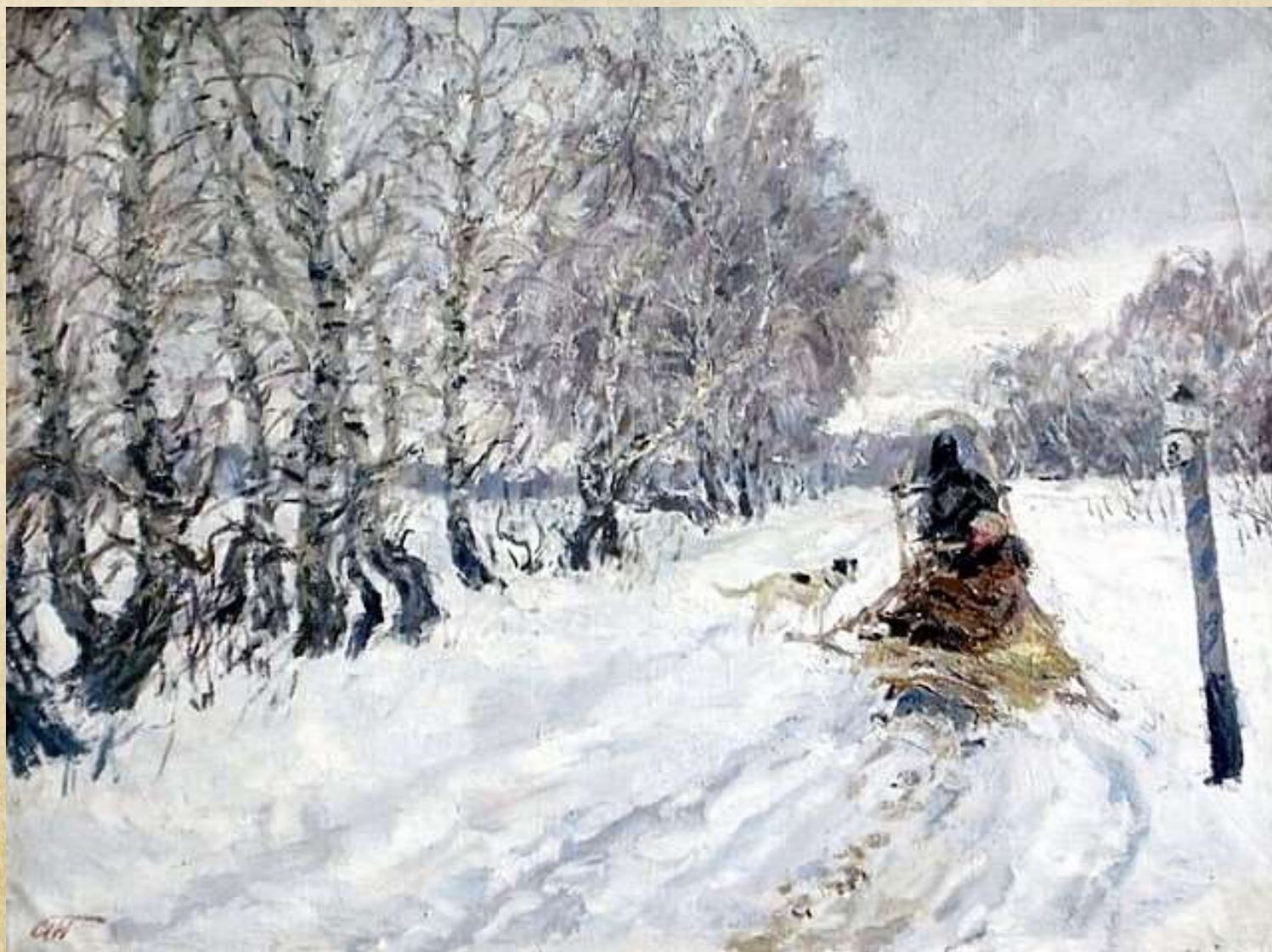
«Дорога из Тагая»