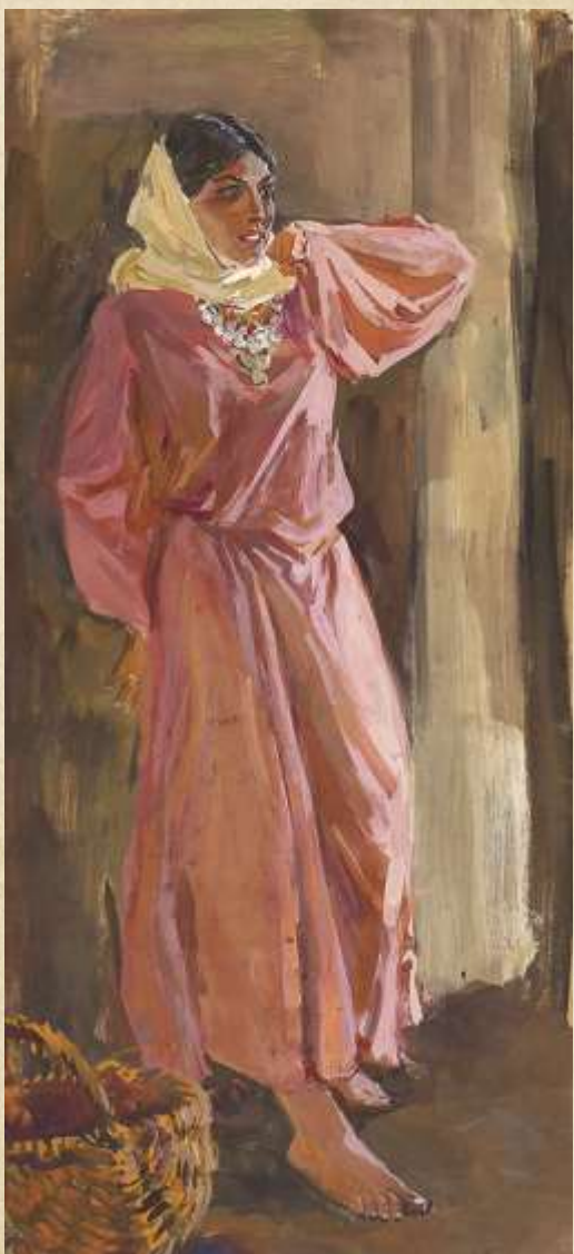
Иллюстрация к повести Л.Н. Толстого «Казачи». Марьяна