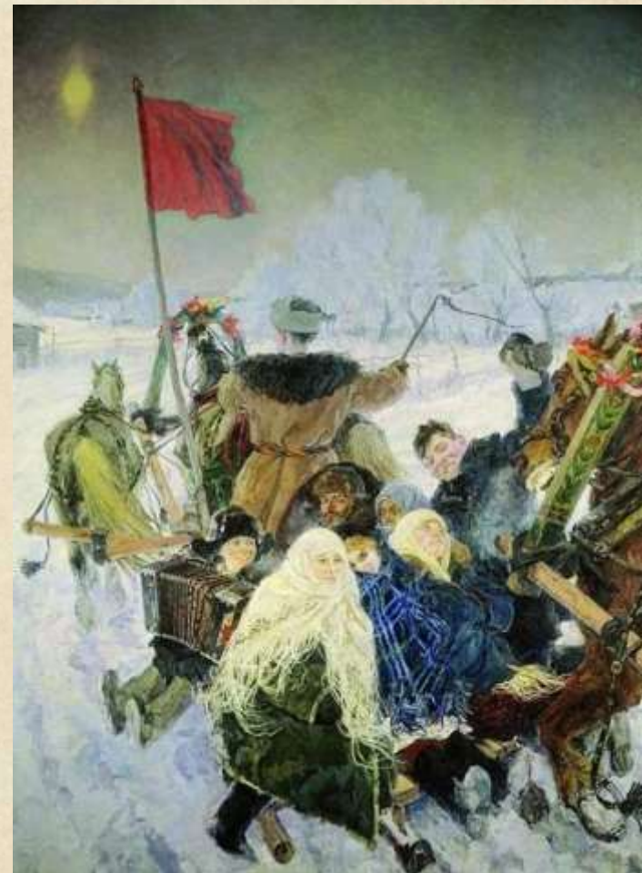
«Едут на выборы»