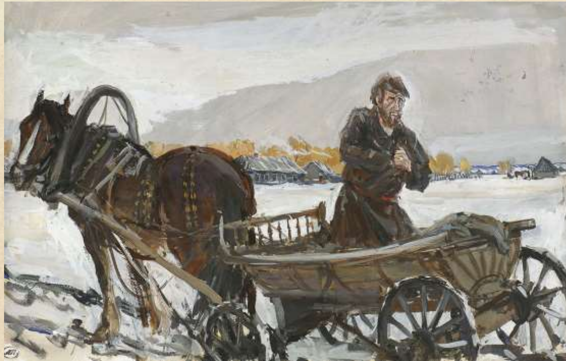
Иллюстрация к повести Л.Н. Толстого «Поликушка»

В 1917 году будущий Народный художник Советского Союза возвращается в родные края. Около десяти лет Пластов проводит в Прислонихе, где началась его творческая и общественная деятельность. В этот период он трудится в поле наравне с односельчанами, которые выдвигают его кандидатуру на пост секретаря сельсовета. Следующие 10 лет трудится над плакатами политической направленности и иллюстрирует произведения отечественных писателей и поэтов.