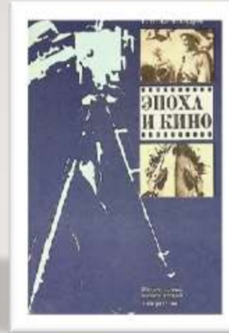
Александров Г. В. Эпоха и кино. – М., 1983. - 336 с.

Когда читаешь киножурнал, смотришь телепередачу, порой встречаются незнакомое слово, о значении которого хочется узнать больше. В этом может помочь издание АЗБУКА КИНО. Оно задумано как краткий справочник для тех, кто любит кино и им интересуется.