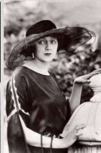
Барбара Ла Марр