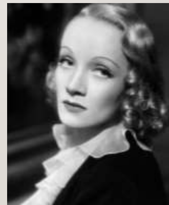
Мария Магдалена (Марлэн) Дитрих