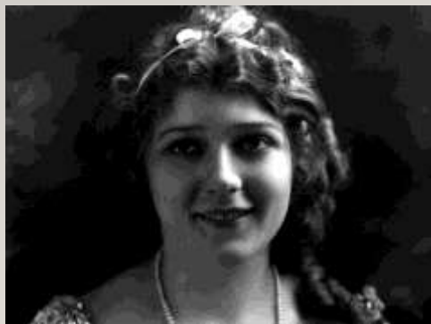
Мэри Пикфорд (Глэдис Луиза Смит)