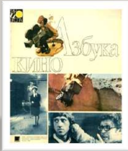
Азбука кино. – М., 1990. - 61 с.

Представляем Вам книги из нашего фонда, которые продолжают знакомить Вас с интересным миром киноискусства!