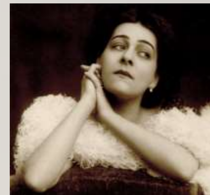
Алла Назимова (Мириам Левентон)