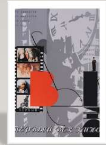
Первый век кино: популярная энциклопедия. – М., 1996. - 720 с.

Книга выдающегося советского кинорежиссера, народного артиста СССР Григория Васильевича Александрова — увлекательный рассказ о первых шагах советского кино, о расцвете нашего киноискусства, о прославленных мастерах, с которыми автор работал или встречался.