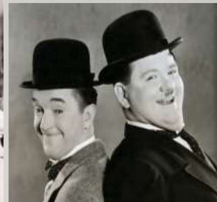
Стэн Лорел и Оливер Харди