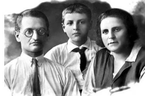
Юрий Левитанский с родителями

В январе 2022 года исполнилось 100 лет со дня рождения русского поэта, переводчика, участника Великой Отечественной войны Юрия Давыдовича Левитанского . Представляем Вашему вниманию рекомендательный список литературы, созданный к юбилейной дате. Все книги Вы можете найти в фонде ЦДСЧ.