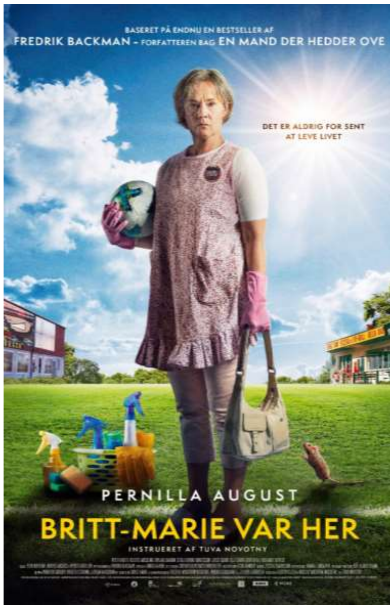
Постер к фильму «Здесь была Бритт-Мари»